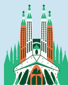
BAZILIKA SAGRADA FAMÍLIA

Petra se nachází v Jordánsku. Toto rozsáhlé město bylo postaveno v 9. století. Bylo vytesáno do kamene Nabatejovci, Arabové kteří byli známí svou vynalézavostí. Fasáda byla dostavěna začátkem 1. století a je hrobkou Nabatejského krále. Výška pozůstatků města je 43 metrů a je vyřezávané přímo do skály.