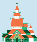
DŘEVĚNÝ KOSTEL BORGUND

Nachází se v Londýně v Anglii, jsou to slavné hodiny budovy parlamentu, který byl postaven v roce 1858. Věž je vysoká téměř 106 metrů a po obvodu jsou 4 ks obrovských hodin, jedny pro každou stranu. V současnosti jsou to nejspolehlivější hodiny jaké existují a vydrží jakékoliv špatné počasí. Název "Big Ben" ve skutečnosti mluví o tom, že uvnitř věže jsou umístěny hodiny, které váží 14 tun.